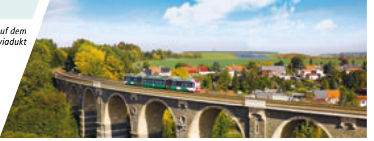
Citylink auf dem Bahrebachmühlviadukt