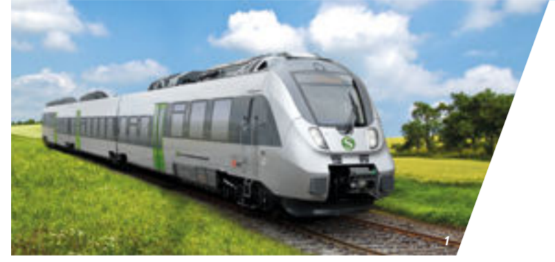
1-3 S-Bahn im Mitteldeutschen S-Bahn-Netz (MDSB)