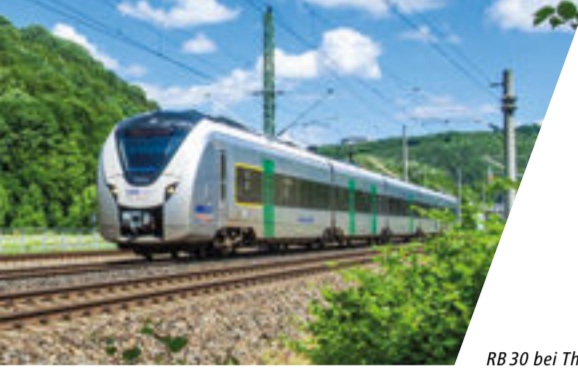
RB 30 bei Tharandt

Wir möchten Ihnen die Nutzung des öffentlichen Verkehrs so einfach wie möglich gestalten und verbessern die Anschlüsse zwischen Bus und Bahn, sorgen für ein einheitliches Tarifsystem, verständliche Informationen und kundenfreundlichen Service.