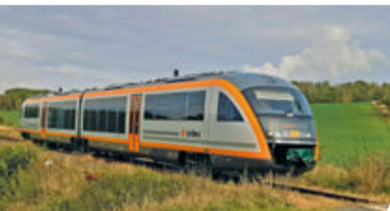
1 Im Zug der ODEG 2 TRILEX-Desiro im neuen Design unterwegs