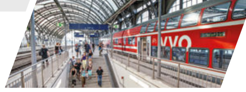
S-Bahn im Dresdner Hauptbahnhof

Weitere Informationen erhalten Sie bei den jeweiligen Bahngesellschaften sowie den InfoHotlines der Verkehrsverbände.