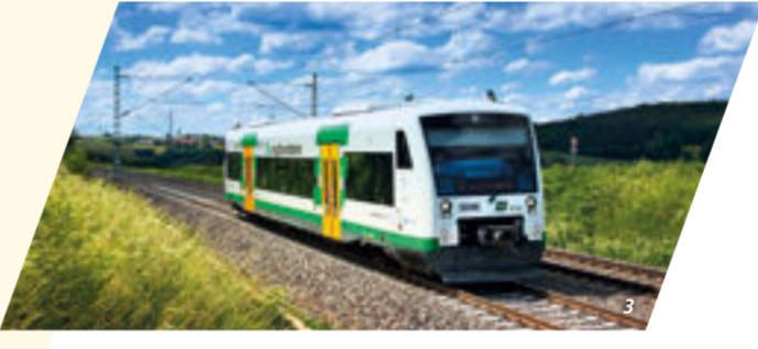
1 Göltzschtalbrücke 2-3 Regio shuttle der vogtlandbahn